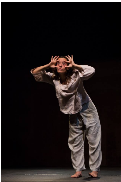
Actuació II Certamen Mujer Contemporánea, Costa Contemporánea, Almería.