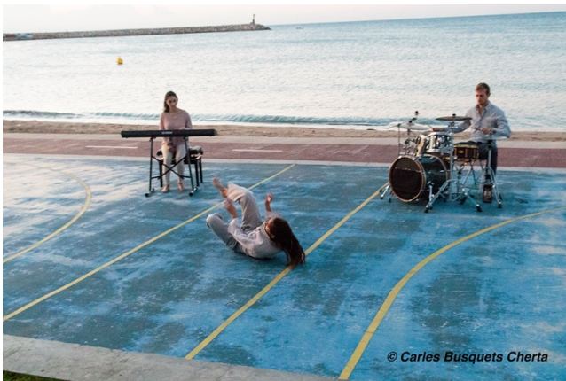
“ARYO” sessió fotogràfica i de rodatge de la producció, Cambrils