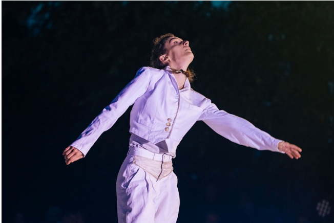
“ARYO” Festival Tanz – Kultur – Dialog Katalonien – Kulturraum, Rosenhof, Alemania 2023