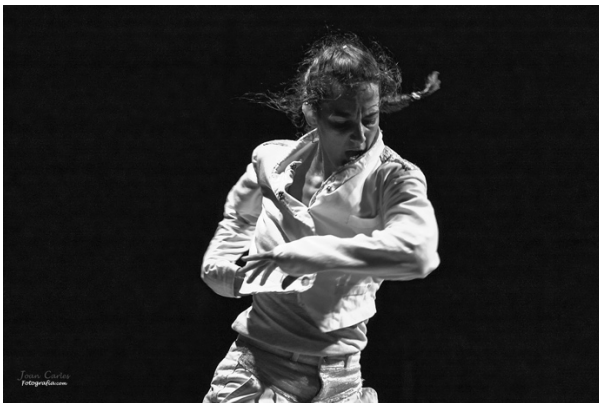
Actuació al Festival Sota la Palmera, Tarragona.